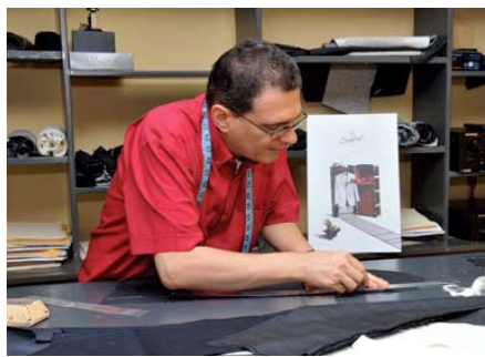
mentre lavorano ad un