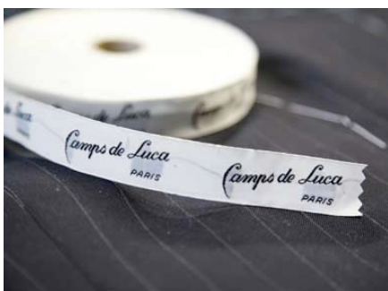
Camps de Luca è considerato uno dei migliori sarti