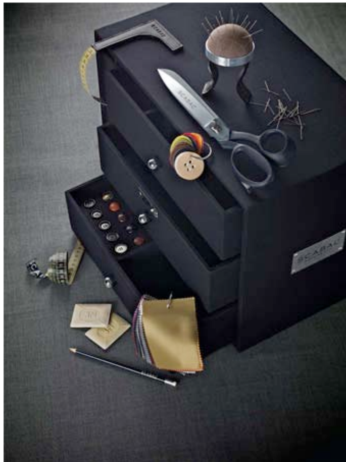
Il kit Scabal

La creazione di un abito su misura comporta molte variabili. Per organizzare questi elementi di 'personalizzazione', Scabal ha creato un pratico ed estetico kit.