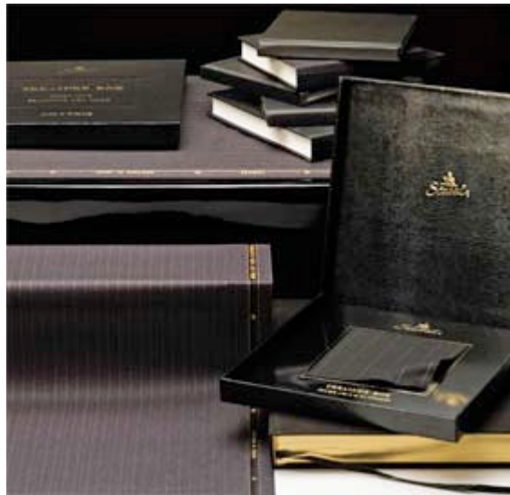
La scatola dei tesori di Scabal

Lusso ed esclusività per un pezzo della nuova collezione Scabal: Treasure Box (La scatola dei tesori).