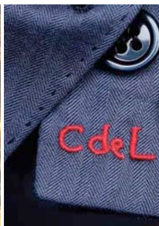
francesi a Parigi