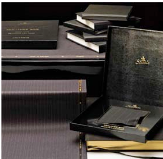
La Treasure Box de Scabal

Un article de la nouvelle collection Scabal se distingue par son luxe pur et son exclusivité : la Treasure Box.