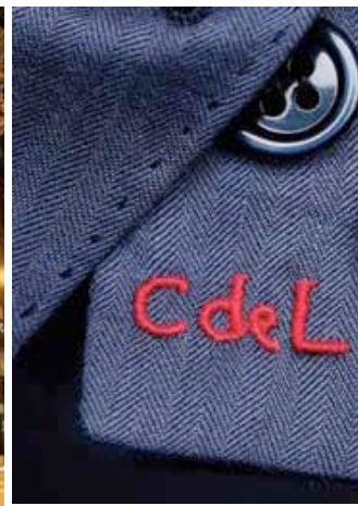
Camps de Luca est considéré comme l'un des meilleurs tailleurs français à Paris