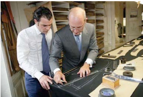
Père et fils travaillant ensemble sur un patron