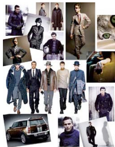
Tableau d'humeur de la prochaine collection hiver de Scabal

« Nos vestes légères seront dans un premier temps présentées avec trois faux boutons et trois poches appliquées. Nous continuons à respecter les valeurs de Scabal : bien que le look soit décontracté, il reste très élégant et offre un sentiment d'exclusivité grâce à la personnalisation. L'acheteur peut choisir un tissu particulier pour les détails, par exemple une belle étoffe pour le dessous de col ou les renforts de coude. Avec Scabal, vous avez toujours le choix – nous n'offrons pas seulement du sur-mesure, mais proposons aussi la personnalisation. »