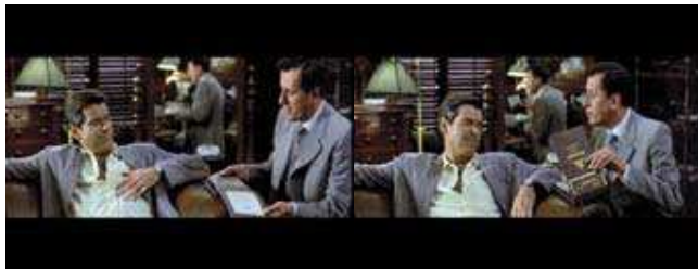
Pierce Brosnan - Geoffrey Rush