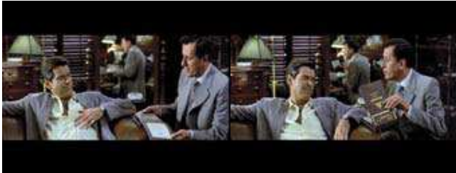
Pierce Brosnan e Geoffrey Rush em O Alfaiate do Panamá