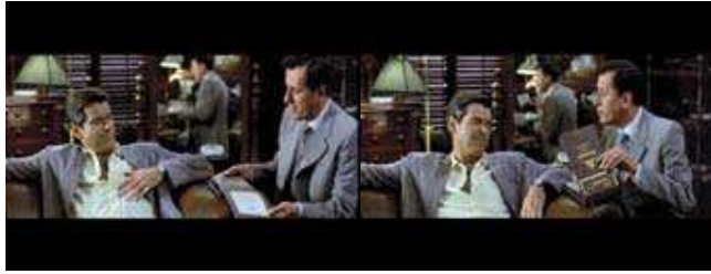
Pierce Brosnan e Geoffrey Rush ne Il sarto di Panama