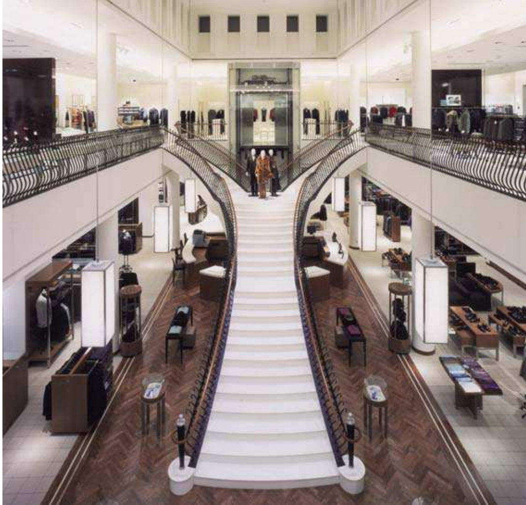
Il negozio di Greenwich, Connecticut