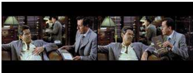
Pierce Brosnan et Geoffrey Rush dans 'The Tailor of Panama'